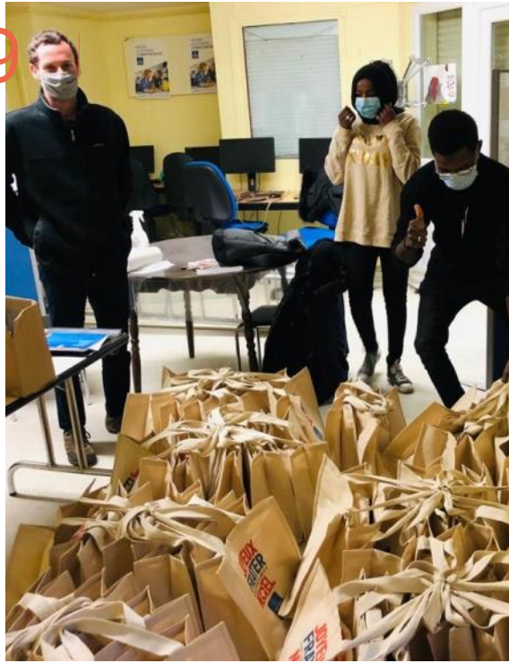
Melun, préparation des sacs-repas pour les personnes du campement.