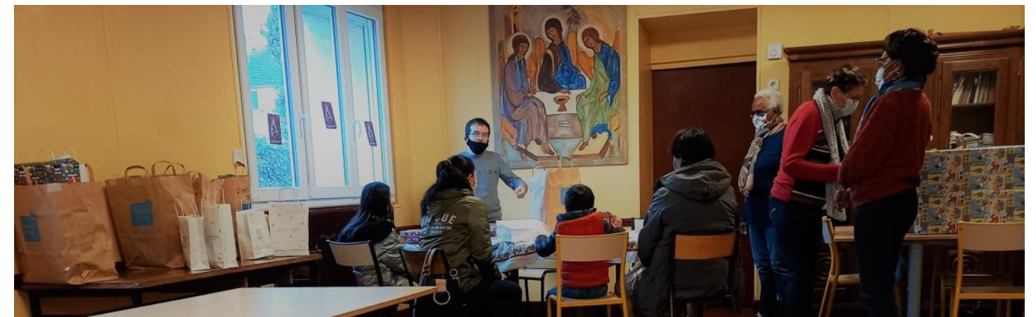
Villeparisis, distribution des cadeaux récoltés aux familles.

« Les étoiles dans les yeux des enfants, ça, ça ne s'oublie pas non plus. »