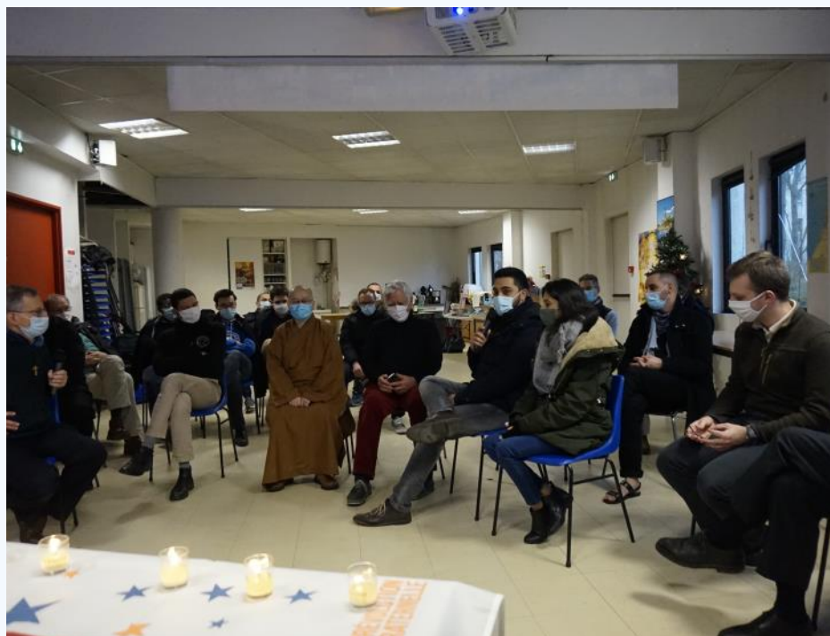
Bussy-Saint-Georges, le 27 décembre 2020, rencontre interreligieuse.

La campagne de fin d'année c'est partager, c'est une ouverture sur l'extérieur, partager tout ce qu'on vit. C'est aussi le moment de faire le bilan avec les gens de la paroisse et de leur expliquer un peu ce qu'on fait. Tout ça se fait en partenariat avec plein d'autres personnes. Moi je mets bien l'accent sur cette ouverture à d'autres puisque cette année, la fête de Noël on l'a faite avec toutes les religions. On a la chance d'avoir l'Esplanade des religions sur Bussy . On a fait notre FraterNoël un peu différemment. On avait plus d'une centaine de sacs en toile de jute et ils ont été rempli par toutes les religions. On avait les bouddhistes, les juifs, les