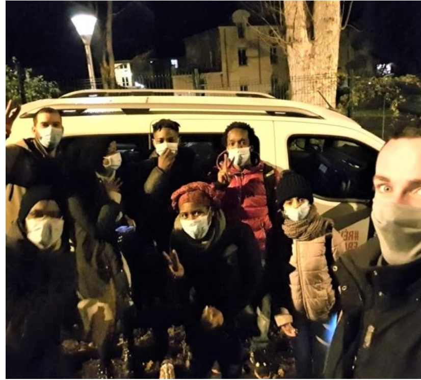
Le 24 décembre, l'équipe des Young Caritas prête à célébrer le réveillon de Noël avec les personnes du campement.