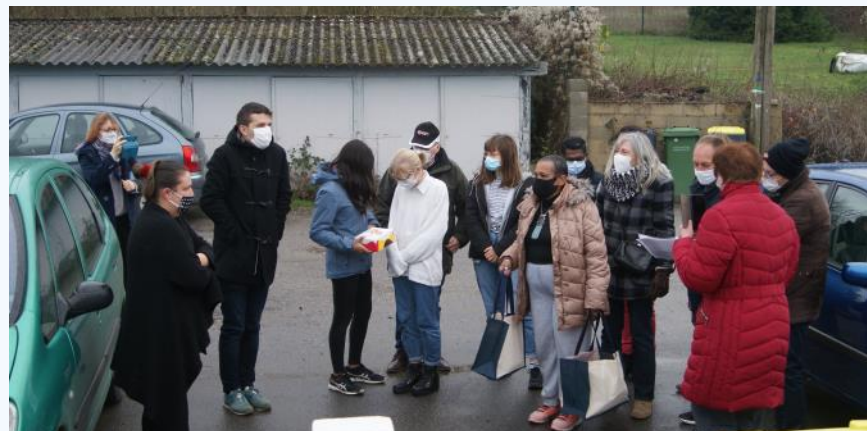
La Ferté-Gaucher, le 24 décembre 2020, distribution de sacs FraterNoël.

du bonheur ! C'était vraiment un beau moment de partage.